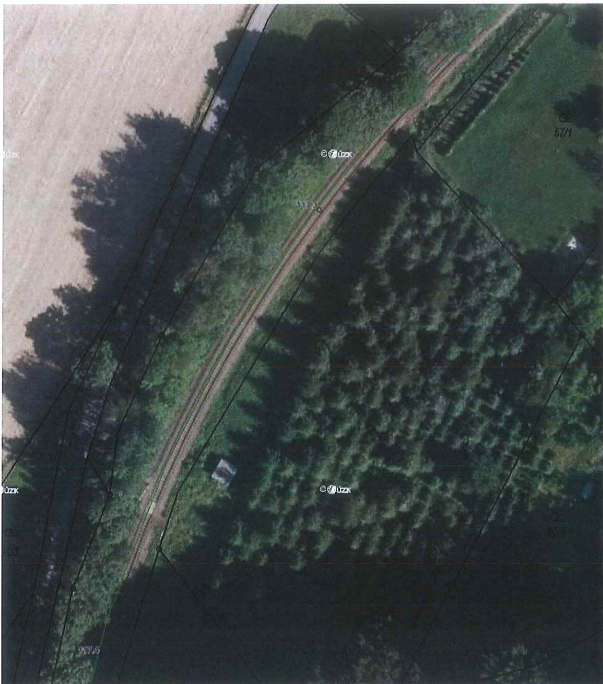
Příloha 4 – Výpis z katastru nemovitostí